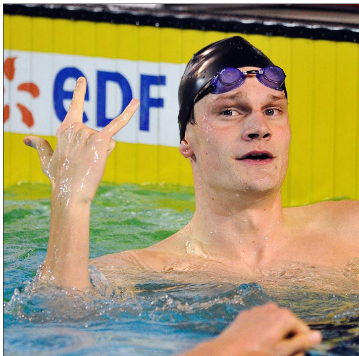
Yannick Agnel vient à peine d'accomplir son effort, qu'il savoure son titre de champion de France du 100 m.

« Je suis un Mikado par rapport aux autres... J'ai pris un peu de chocolat, mais je reste un Mikado ». C'est ainsi que Yannick Agnel se qualifiait avant le grand rendez-vous d'hier. Ce qui ne l'a pas empêché de maîtriser les costauds dans une finale du 100 m initialement emmenée par Fabien Gilot (22''99), Frédéric Bousquet (23''01) et Alain Bernard (23''07), qui ont viré dans cet ordre à mi-