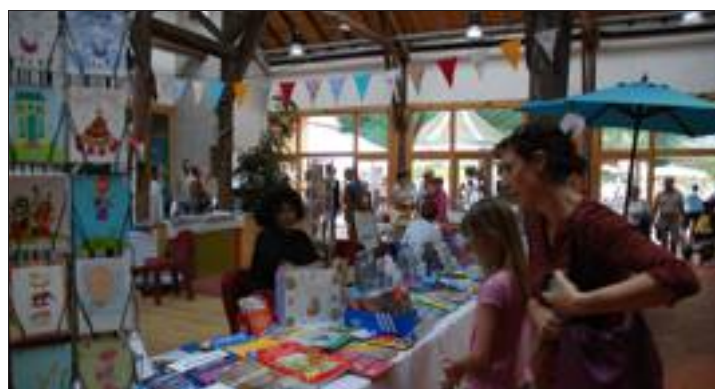
Les enfants ont aussi leur place à la Fête du livre : librairies spécialisées et auteurs de livres pour la jeunesse, jeux, spectacles et contes sont prévus pour eux.

La Fête du livre, organisée dimanche 25 septembre au Parc de Wesserling par l'association Ouvert' Thur, offre l'occasion de rencontres et de coups de cœur, de découvertes et de dédicaces. Un concours de marque-pages est proposé cette année.