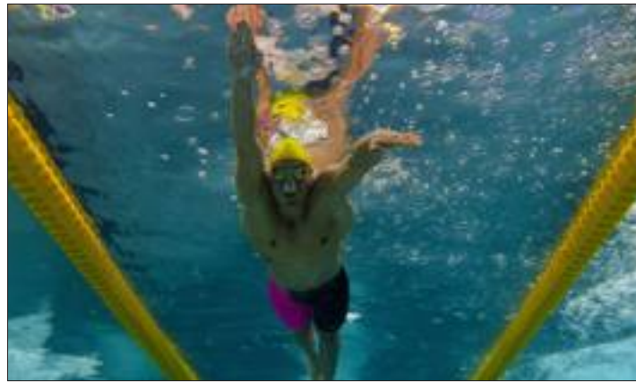
En 49''01'', Florent Manaudou n'a pas forcé pour décrocher le meilleur temps en demi-finale du 100 m.