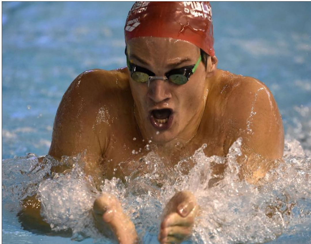
La brasse n'est certainement pas sa spécialité (il dit même ne pas savoir la nager !), mais Yannick Agnel a remporté hier à Montpellier le titre national du 200 m 4 nages.